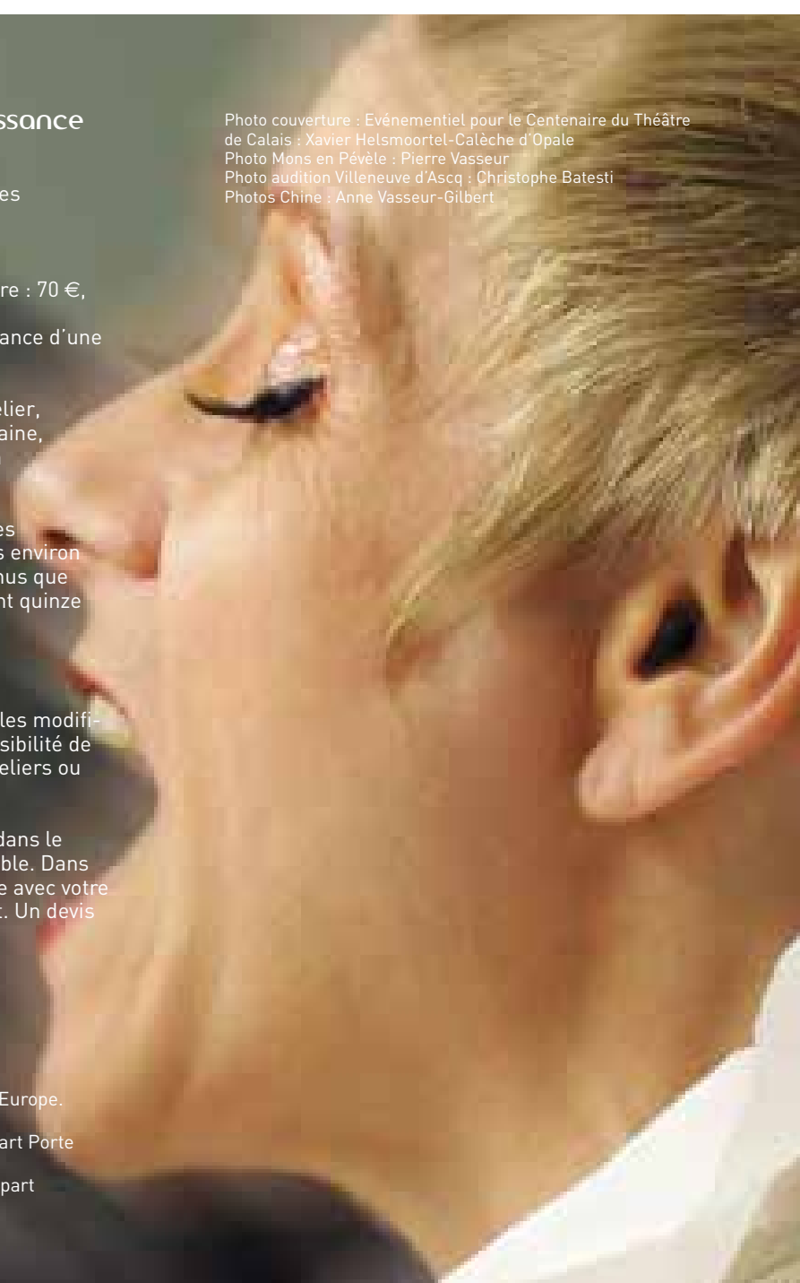
Photo couverture : Événementiel pour le Centenaire du Théâtre de Calais : Xavier Helsmoortel-Calèche d'Opale Photo Mons en Pévèle : Pierre Vasseur Photo audition Villeneuve d'Ascq : Christophe Batesti Photos Chine : Anne Vasseur-Gilbert